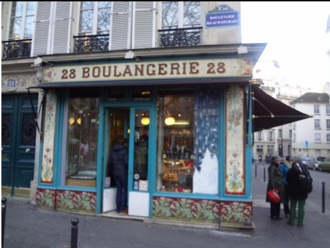
La sonnette de la porte