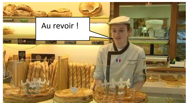
La boulangère qui dit : « Bonjour ! » et « au revoir ! »