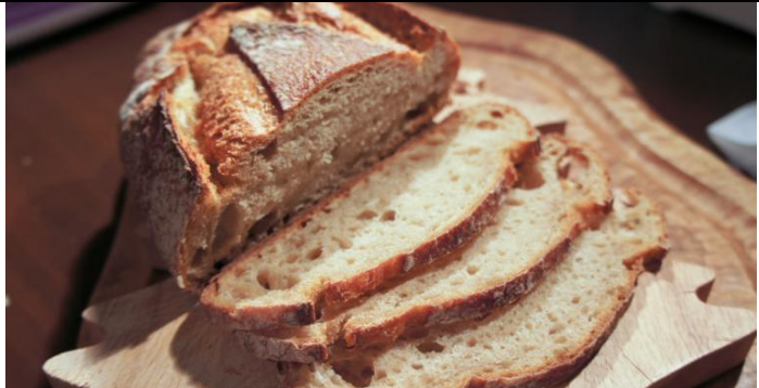
Couper le pain