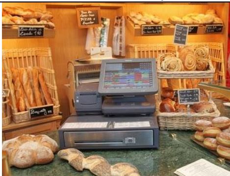
La caisse enregistreuse